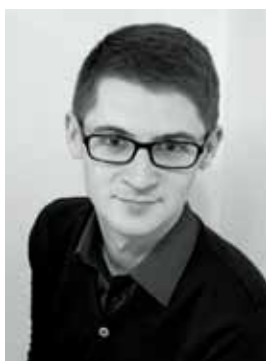
OV CRISTIAN NOROCEL

– MANLIGA IDEAL INOM HÖGERRADIKAL POPULISM I NORDEN AV OV CRISTIAN NOROCEL